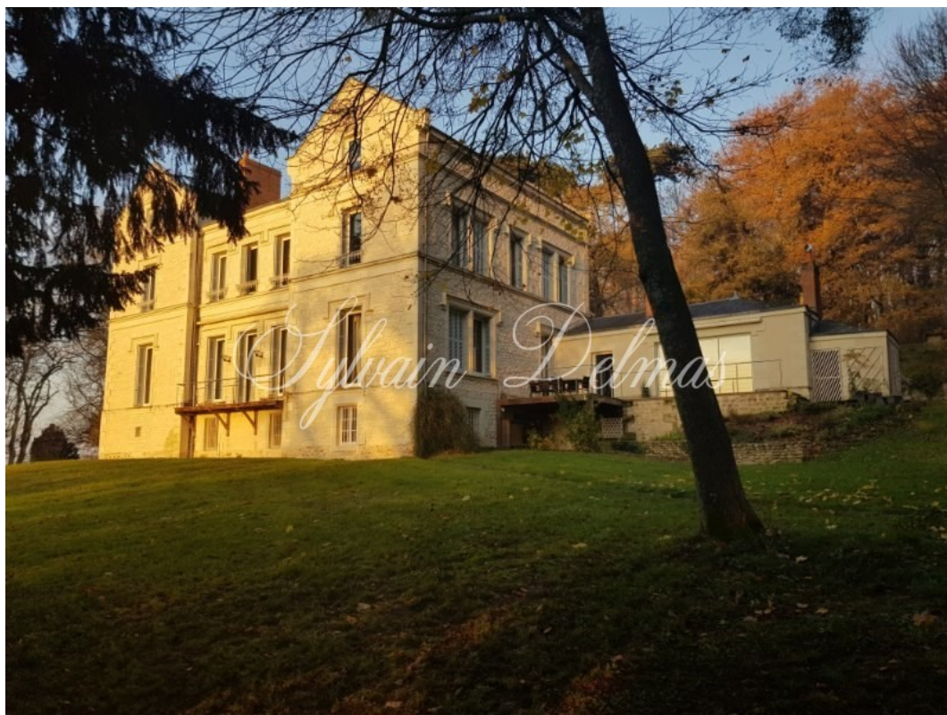
CHÂTELLERAULT, Vienne, FRANCE