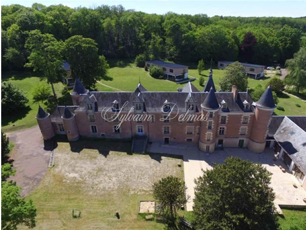
LA ROCHE-POSAY, Vienne, FRANCE 1 500 000 €