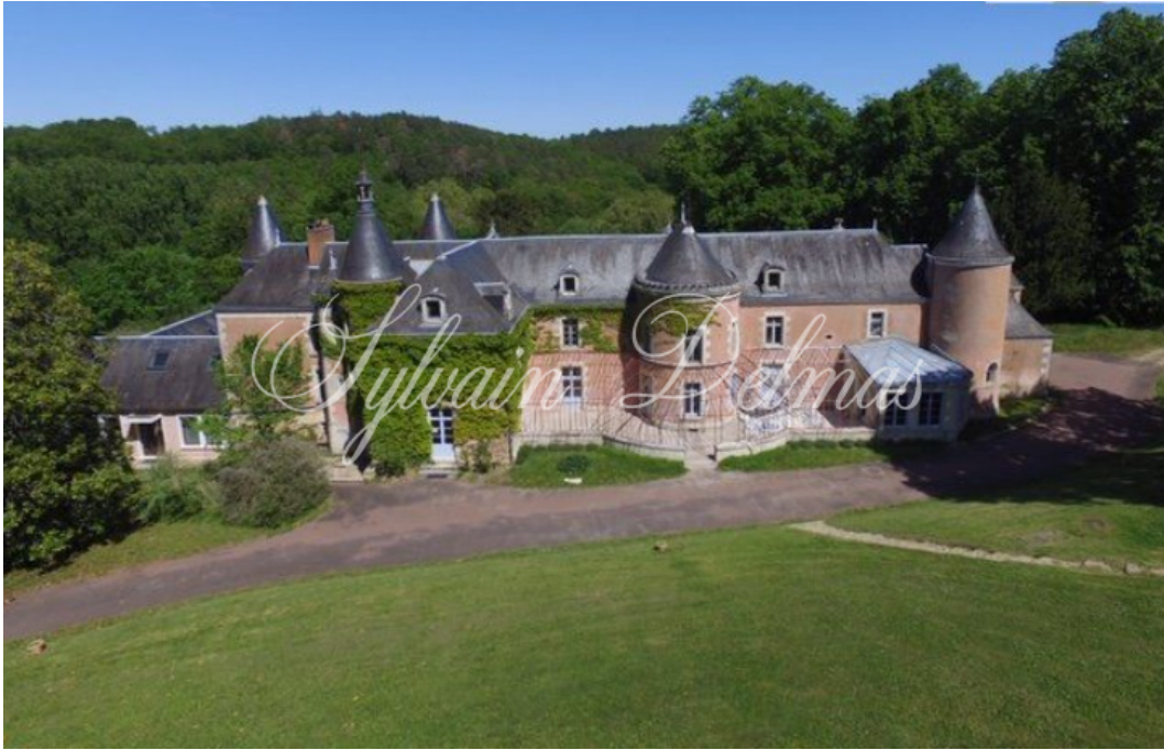
LA ROCHE-POSAY, Vienne, FRANCE 2 500 000 €