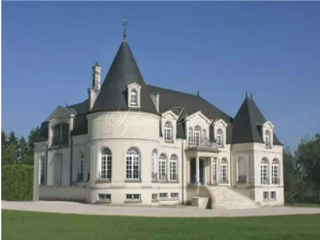
REIMS, Marne, FRANCE 1 280 000 €