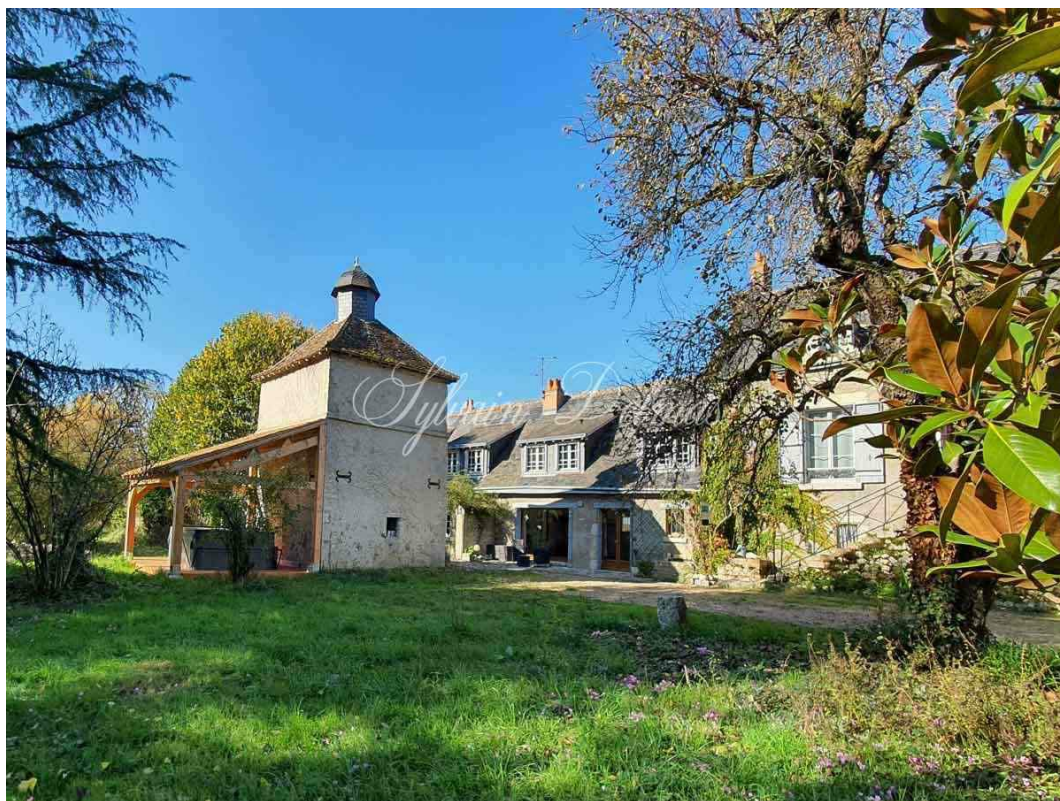
AMBOISE, Indre-et-Loire, FRANCE