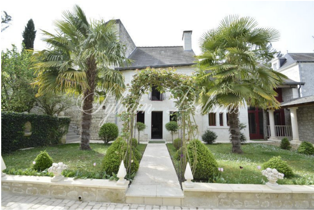
CHINON, Indre-et-Loire, FRANCE 535 000 €