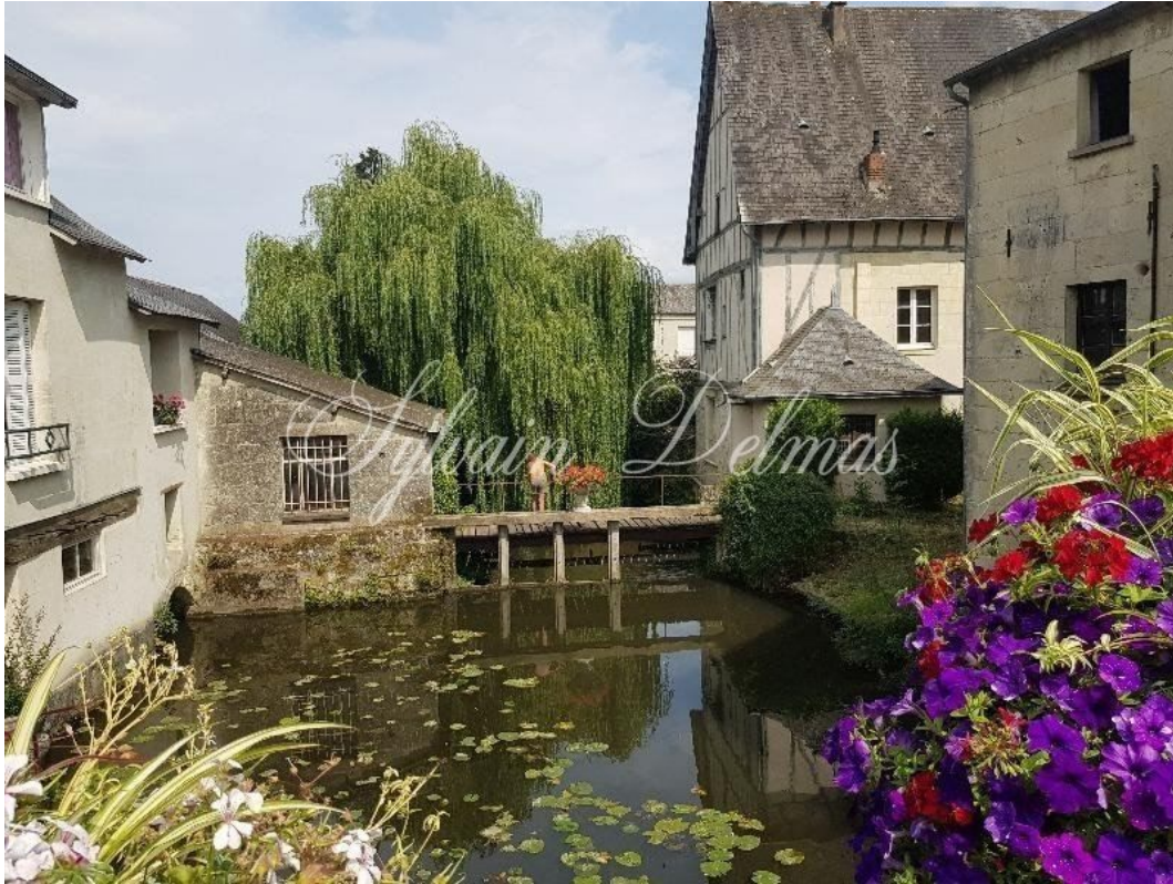
TOURS, Indre-et-Loire, FRANCE 400 000 €