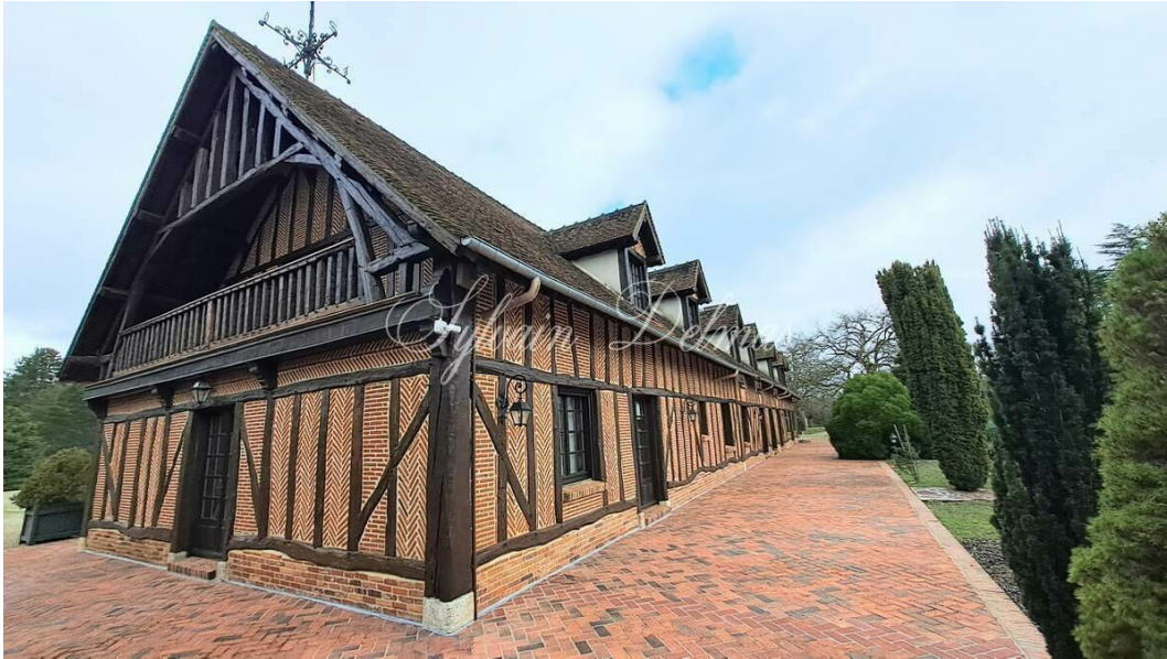
LAMOTTE-BEUVRON, Loir-et-Cher, FRANCE 6 900 000 €